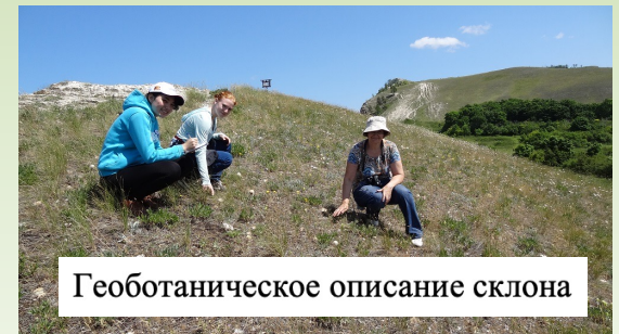
Геоботаническое описание склона

В рамках проекта будет продолжена важная работа по созданию защитной экологической тропы на природном объекте «Молодецкий Курган» национального парка «Самарская Лука». Наличие на охраняемой природной территории туристической инфраструктуры в сочетании с информационными стендами – это один из действенных методов защиты местообитаний уникальных растений и животных как создание альтернативных природным условиям для отдыха туристов, и тем самым не вмешательства в дикую природу. Сотрудники национального парка с нетерпением ждут помощи наших волонтеров, планируется 2 выезда в этом направлении.